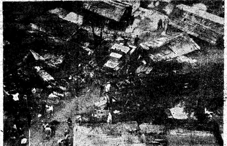
Urme ale incendiului devastator.

Material primit de la Comandantul Grupului de pompieri al județului Hunedoara