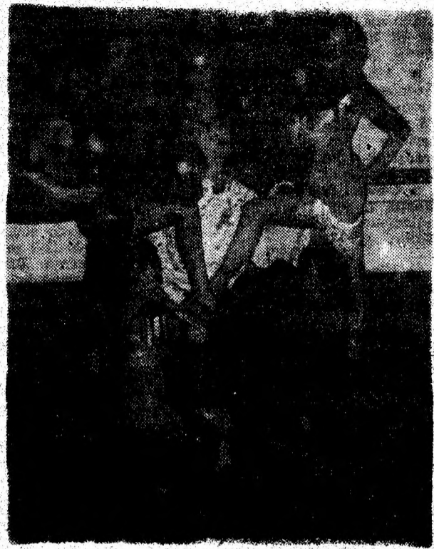
Trecătorule, e ger / Ninge peste tine, Haf la „Lido“-n casa mea / Unde-i cald și bine.

Susținut de trupa de balet și soliștii baletului. Melodii îndrăgite, sexy dance, surprize. ● Spectacolele vor începe din data de 20 noiembrie 1993. ● Rețineri de locuri, zilnic, la tel. 627536.