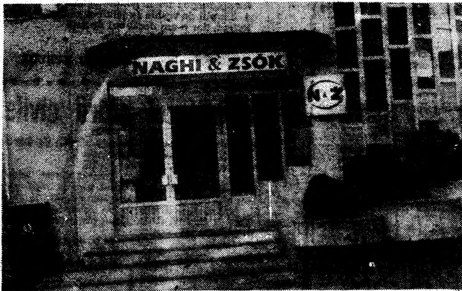
Intrarea în noua clădire.

Magazia de produse finite nu prea stă plină, deoarece solicitările sunt mari. Acum însă, la inaugurarea noii capacități de producție, era firesc să poată fi prezentate ultimele modele de articole sportive și confecții textile create de specialiștii firmei.