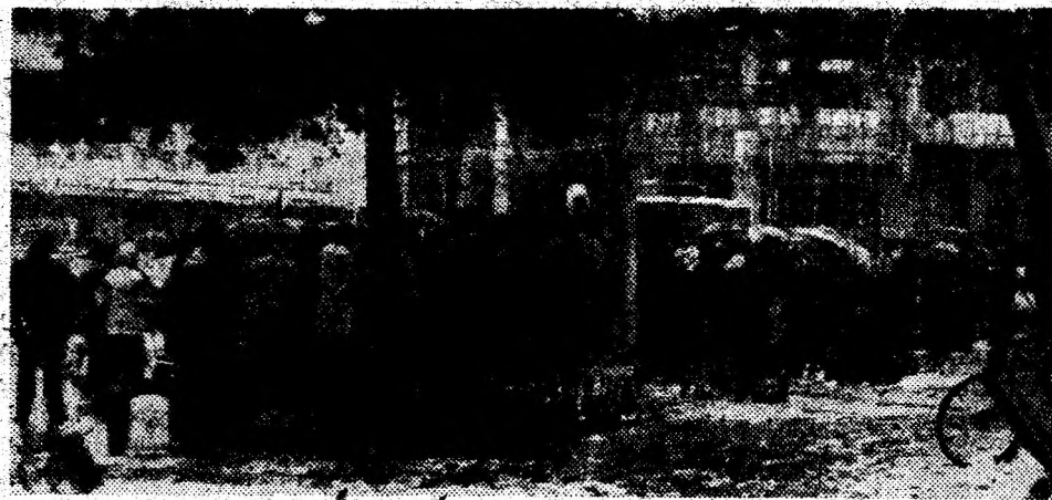
Marți, pe o dimineată ploioasă și friguroasă, în două puncte ale orașului Brad, sute de localnici așteptau sosirea buteliilor de aragaz. S-au făcut liste de ordine. Spre norocul lor, buteliile mult așteptate au sosit!

• 1901. A murit V. A. URECHIA (n. 1834), istoric, scriitor și om politic român. A publicat „Istoria românilor” — 14 volume, „Istoria școlilor de la 1800 — 1864”, romane, piese de teatru.