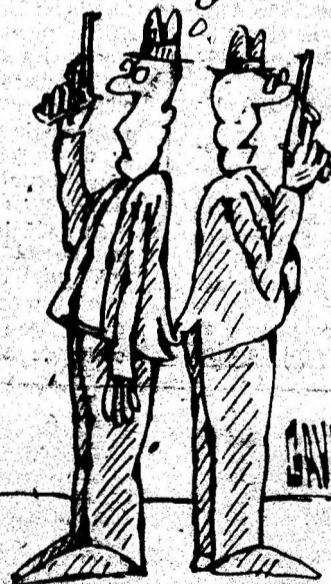
Desen de CONSTANTIN GAVRILA