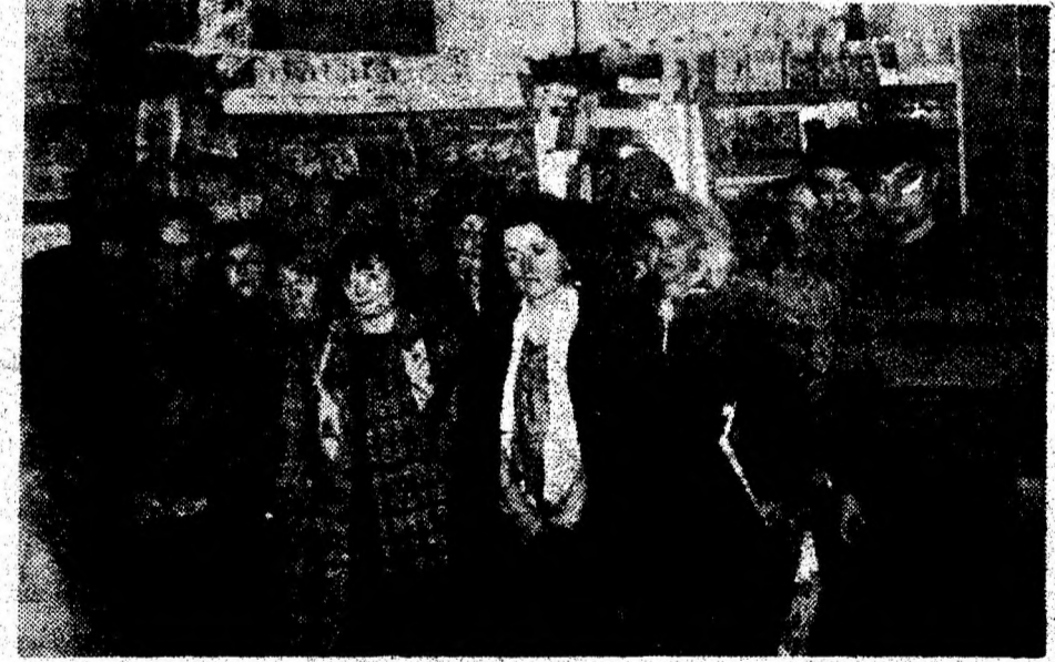
Scriitori hunedoreni participanți la deschiderea „Salonului cărții” la Deva.