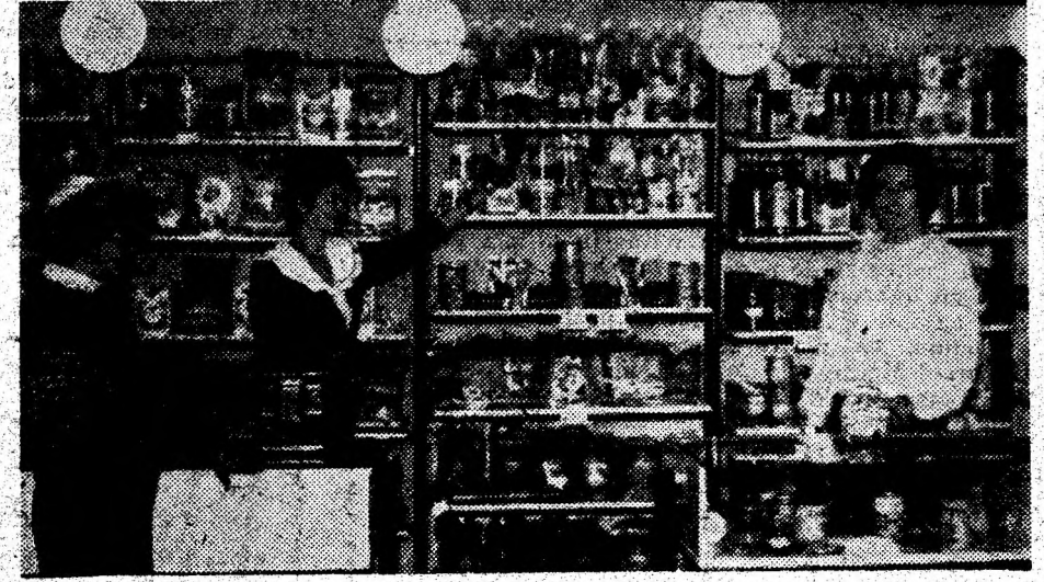
MAGAZIN GENERAL. În Complexul Central din Piața mare a Devei a fost redeschis — renovat și modernizat — un magazin general al firmelor „Alim-serv” S.R.L. Deva și S.C. „Agrotur” S.R.L. Șoimuș. Aprovizionat cu o gamă bogată și diversă de produse, noul magazin își așteaptă cumpărătorii. (D.G.)

De mai multă vreme locuitorii comunei Certej mănâncă o pâine atât de bună, încât vârstnicii, care în copilărie îi duceau dorul, spun că e „jimblă”. Calitatea pâinii o datorăm harnicului colectiv de la brutărie, condus de tânăra Sorina. Cât de bine ar fi în comună dacă toți și-ar face datoria ca această tânără, care se bucură de respect și recunoștință pentru calitatea pâinii noastre cea de toate zilele. (Prof. VALERIA BLAJ, Certej).