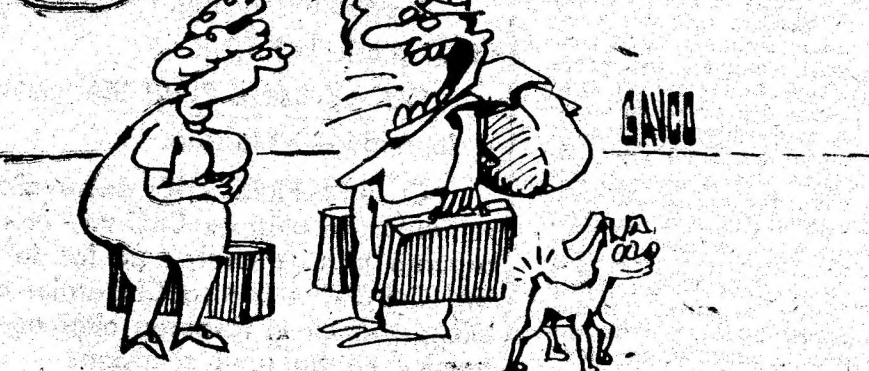
Desen de CONSTANTIN GAVRILA

IATĂ-NE ȘI-N OCCIDENT. TI-AM SPUS DE-ACASA CA ASTIA AU TĂIAT COZILE LA TOȚI CĂINII ?!