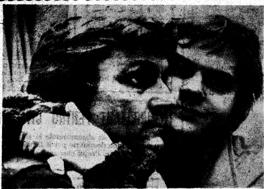
Prezenți la Deva, într-un spectacol: Cei doi „Piersici” — tatăl și fiul.

...O testare pentru mulți patroni pe tema: până unde ridicați prețurile, stimați domni? (Gh. I.N.)