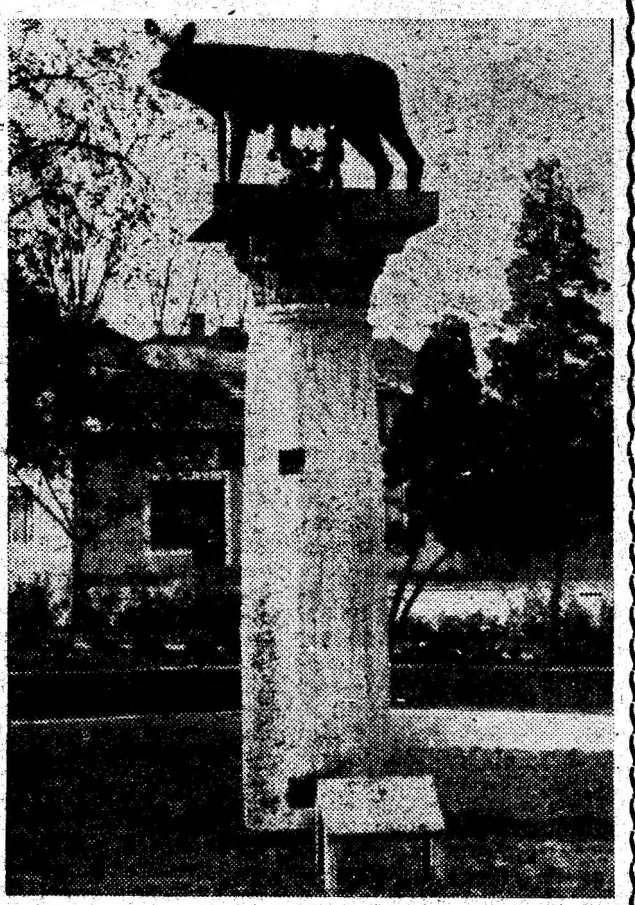
În Parcul Eroilor din Alba Iulia a fost ridicată statuia Lupoacei ca simbol al originii noastre latine.

Veniți români la Alba Iulia! DUMITRU GHEONEA, MINEL BODEA