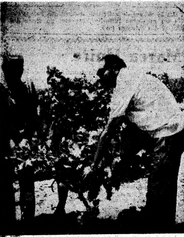
Gianaclis — EGIPTE. Pe terenurile simulo de sertului și redete agriculturii se plantează livezi de pomi și viță de vie.