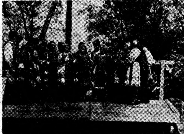
La 20 de ani de activitate, dubașii din Pojoga rămân un ansamblu înfloritor, apreciat pe scene din județ și din întreaga țară.