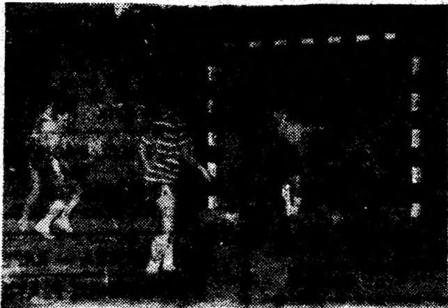
Minifotbalul în sală atrage în fiecare iarnă numeroși spectatori.