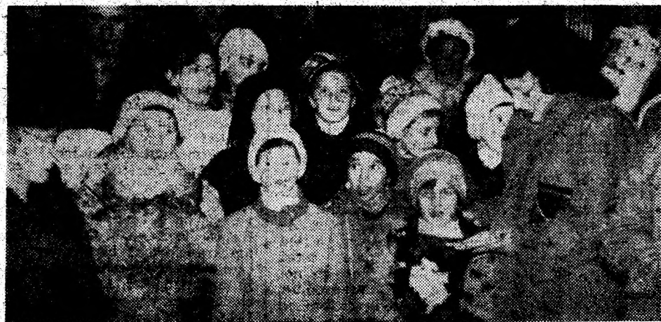
Elevi din Lunca Moșilor, împreună cu învățătoarea lor, colindând în biserică în ziua de Crăciun.