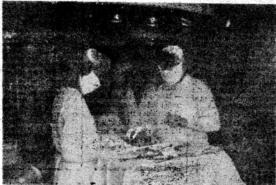
În sala de operație a secției chirurgie se pregătește o nouă intervenție.