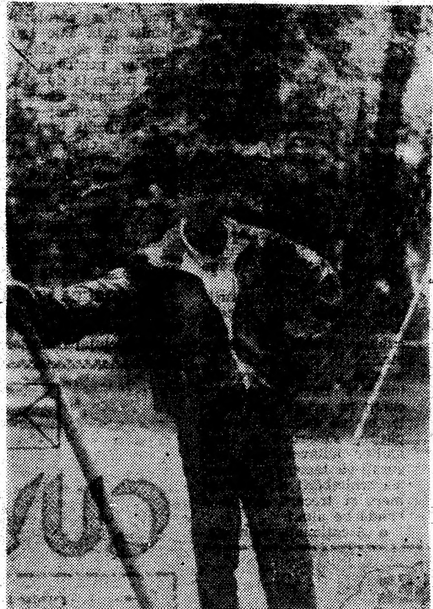
În parc.

nor legende, cum că ar fi implicate în apariția cancerului genito-mamar. Nimic mai puțin adevărat — susțin medicii. Mai ales în cazul anticonceptionalelor mai noi, ca Microgenonul sau Marvelonul, care au un conținut scăzut de estrogen (hormon presupus a fi în legătură cu cancerul mamar). Se crede, de asemenea, că lagrăși. Este drept că femeile câștigă puțin în greutate, dar de fapt pilulele rețin apă, care se elimină ușor. Există însă destule avantaje ale anticonceptionalelor față de avort, între care și costurile.