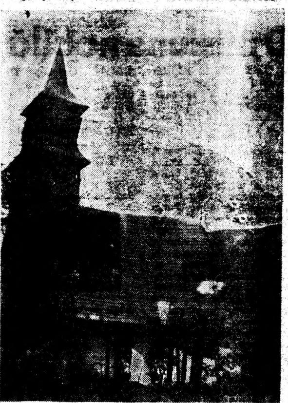
Biserica monument istoric din Almașu Mic de Munte.