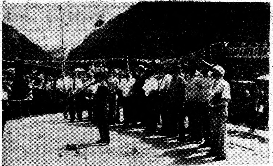
Aspect de la manifestarea „Întâlnirea moșilor cu istoria”, care s-a desfășurat duminică, 3 iunie a.c., la Dupăpiatră.