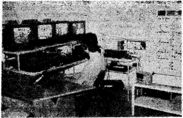
Studioul de televiziune prin cablu DEVASAT s-a impus prin emisiuni variate și de calitate. De la aceste monitoare se supraveghează permanent calitatea imaginii și a sunetului.