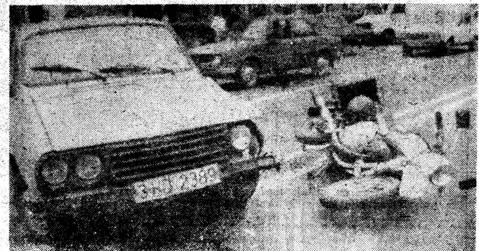
Dacia din imagine, întorcând în drum pe strada Ilorca, din Deva, peste linia continuă dublă și fără asigurare din spate, a blocat drumul motocicletei, ai cărei ocupanți au scăpat ca prin minune. Dacă nu se respectă regulile de circulație...!

Pentru astfel de fapte, pe lângă amendă, legea prevede și suspendarea dreptului de a conduce pentru o perioadă de la 1-3 luni.