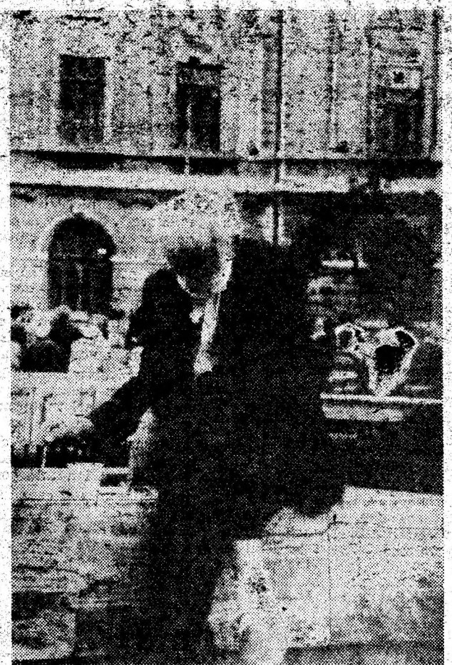
„Intr-o lume agitată, Mai e timp și pentru artă...”

(Continuare în pag. a 3-a) VALENTIN NEAGU