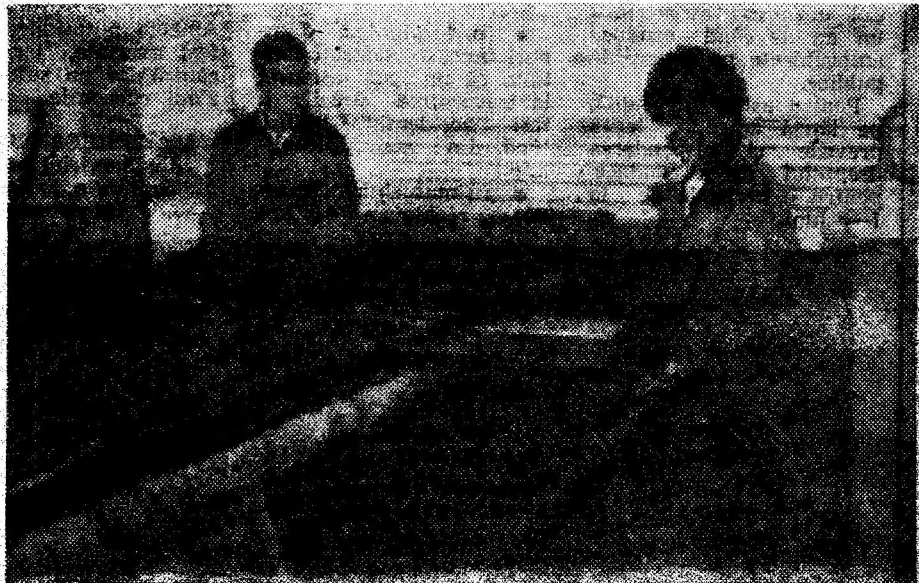
Dotarea cu utilaje moderne a fabricii permite onorarea în condiții ireproșabile a comenzilor fiecărui client.