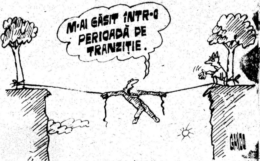
Desen de CONSTANTIN GAVRILA

GRUPUL ȘCOLAR AGRICOL GEOAGIU ANUNȚĂ ORGANIZAREA UNUI NOU CONCURS DE ADMITERE ÎN LICEU ȘI ȘCOALA PROFESIONALĂ ÎN PERIOADA 30 AUGUST — 1 SEPTEMBRIE 1994, PENTRU URMĂTOARELE LOCURI RĂMASE NEOCUPATE: