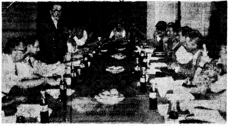
Aspect din timpul desfășurării mesei rotunde, organizată de L.A.D.O.

turile omului nu sunt complete. În drepturile omului intră și drepturile proprietății (C-tin Mecăniță). • În ultima vreme s-au obținut numeroase libertăți, cum ar fi libertatea presei, dreptul la grevă, la opinie ș.a. (H. Ștefănescu). Președintele Clinton, în cadrul vizitei în țările baltice, a recunoscut nulitatea Pactului Ribbentrop—Molotov, dar numai cu privire la statele respective, nu și la Moldova (G. Rădulescu, I. Ceaușescu). • Insistența excesivă asupra respectării drepturilor lor dăunează chiar etniei maghiare. Cel ce futuroa lozina drepturilor omului, chiar ei nu le respectă. S-au pierdut drepturi fundamentale: dreptul la muncă, la instrucție și la locuință (V. Burtea). • Trebuie să schimbăm mentalitatea unora asupra drepturilor omului, să defrișăm legile din acest domeniu. • Unii cer stat de drept, dar, de fapt, nu-l vor. Astăzi foștii torționari de ieri ne dau lecții de democrație. • Cetățenia română presupune atât drepturi, cât și obligații. Nu poți numai cere, fără să dai nimic țării unde trăiești. • Drepturile omului presupun și dreptul la informare corectă, ceea ce statul n-a făcut cu privire la fenomenul „Caritas”. (Gh. Pogăncu).