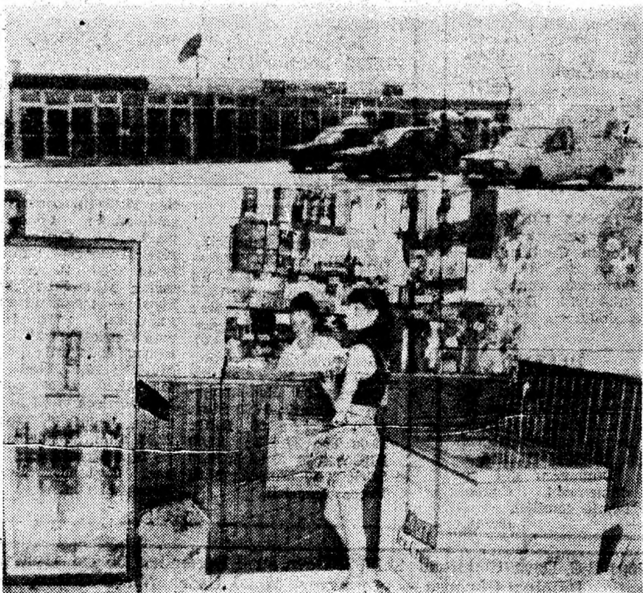
S. C. OCTAN PETROM S.R.L. Deva, o unitate cu program non-stop și cu servicii de elită.