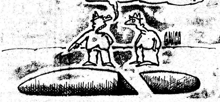
Desen de CONSTANTIN GAVRILA

CÂND TE GÂNDEȘTI CĂ ERA SĂ-I CALC PE URME!