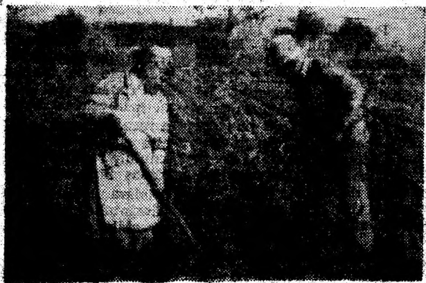
„La sapă“.