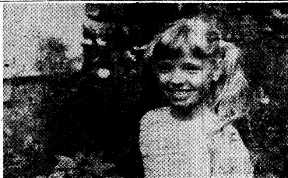
O floare între flori. Foto GABRIEL DRĂGAN — Deva.