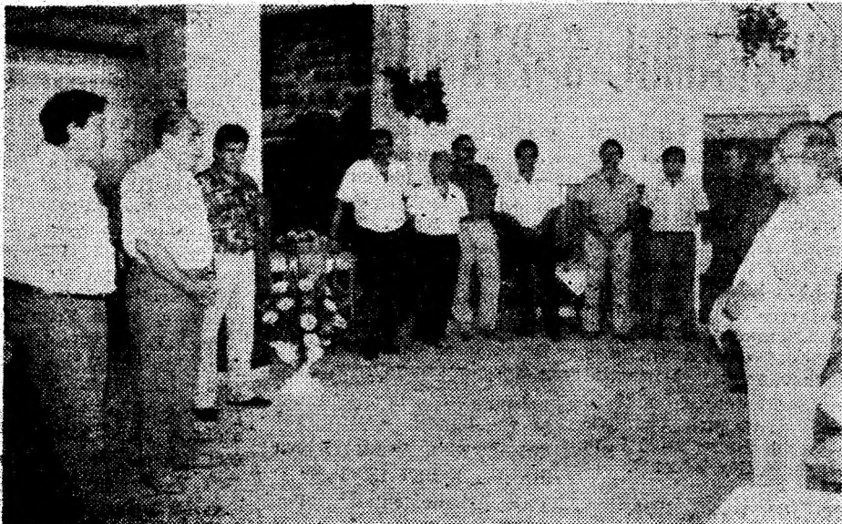
Moment de la deschiderea Clubului „Energeticianului” din Deva.

Este bine că acei care au posibilități mai fac câte ceva și pentru timpul liber și pentru sufletul propriilor salariați și nu doar pentru angajamentul în producție. Ceea ce s-a făcut, oricum rămâne. Trebuie însă gospodarit judicios, păstrat cu atenție. (D.G.)