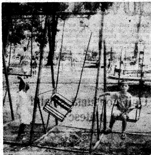
Cam așa arată o parte din hintele ce supraviețuiesc de ani și ani în parculețul copiilor din municipiul Deva.

Dublin, cunoscut drept orașul celor 1000 de grupuri, unde la fiecare colț de stradă vezi oameni care cântă la vreun instrument, este leagănul a numeroase trupe anonime, dar care prin muzica pe care o promovează, reușesc să se afirme nu numai în Irlanda sau Anglia, ci și în întreaga Europă. Ultimul produs al acestui oraș este Therapy?, grup format în 1989, în formula Andy Cairns (chit. voce), Michael McKeehan (bass) și Fyfe Ewing (bat.), și care înregistrează cea mai rapidă ascensiune din acest an, fiind apreciat deja de specialiști drept grupul anului 1994.