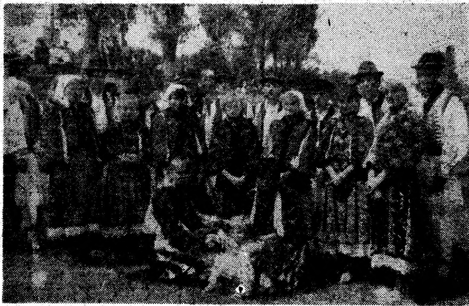
Laureații celei de a IV-a ediții a Festivalului Pădurenilor.