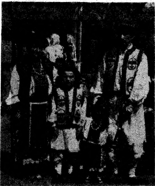
Familia Tuza, din Ruda, comuna Ghelari, în frumoasele costume pădure nești.

— Festivalul Pădurenilor este o manifestare de suflet a oamenilor de pe aceste locuri. Să-i întărim tradiția, să-l iubim.