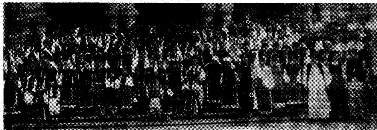
Participanții la Festivalul Pădurenilor în fața impunătoarei catedrale ortodoxe, de unde a pornit parada portului popular.