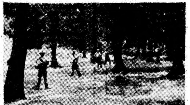
Cercetare intr-o zona impadurita.