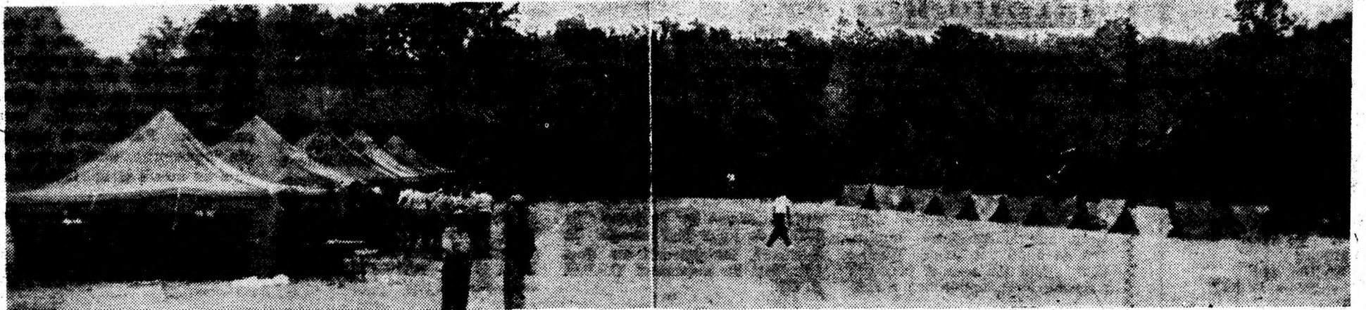
Punctul de dislocare a subunității.