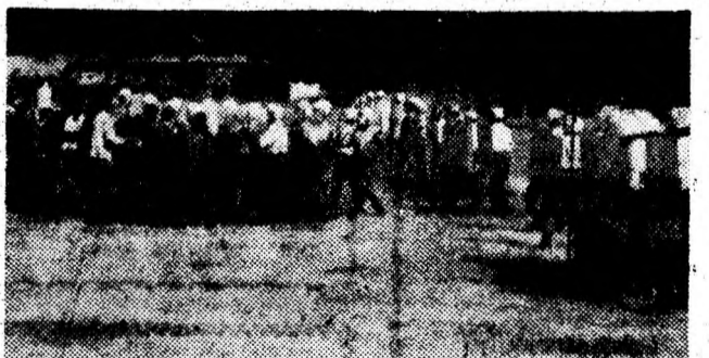
Restabilirea ordinii și liniștii publice — important domeniu al activității jandarmilor.