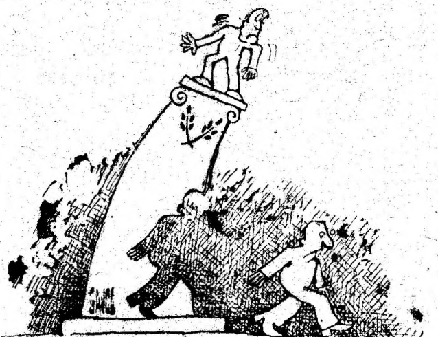
Desen de CONSTANTIN GAVRILA

Relațiile de serviciu nu vă satisfac. Vă va atrage divertismentul. Enerării legate de un părinte, de o călătorie pe care n-o puteți face. Un eveniment mă pușin plăcut în familie. Păziți-vă sănătatea.