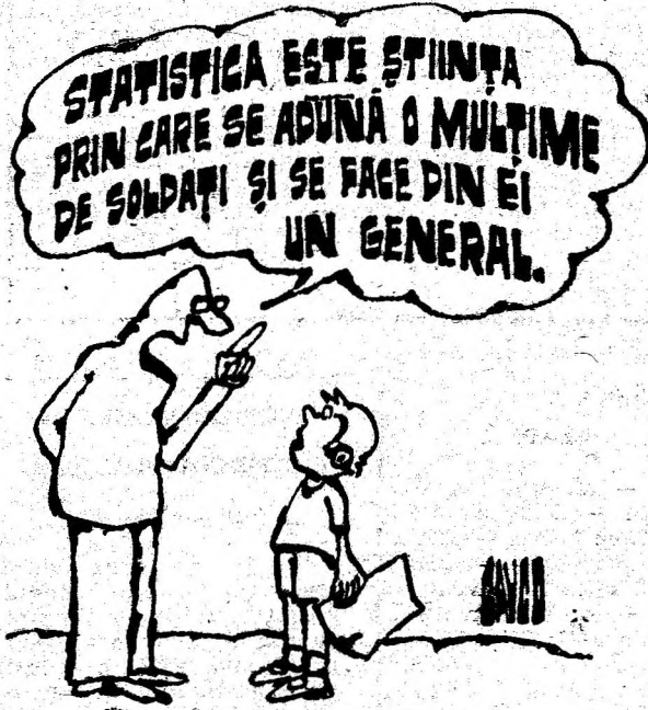
Desen de G. GAVRILĂ

În localitatea Crișcior și nu numai, numărul animalelor a crescut. Fiecare gospodărie și-a întregit gospodăria cu o vacă, o oaiă, o capră. Acest lucru este mult apreciat, dar unii dintre aceștia nu au unde să le pască și atacă din plin terenurile consătenilor, ținându-și animalul de funie sau lanț. Oare nici acum nu se respectă dreptul de proprietate al omului, știindu-se că unitățile agricole au fost desființate? Este de datoria consiliilor locale să-i pună la punct. (A.B. J.)