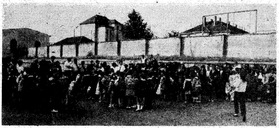
-Aspect de la deschiderea noului an școlar la Școala Generală Nr. 1 Deva.