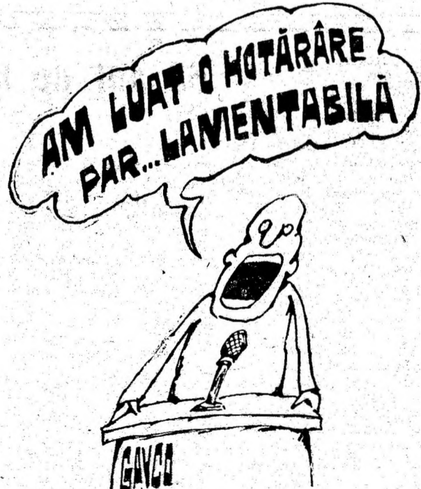
Desen de CONSTANTIN GAVRILA