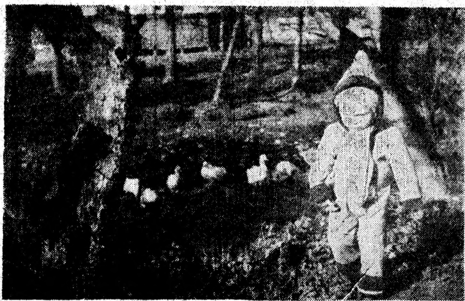
Toamna se numără bobocii...