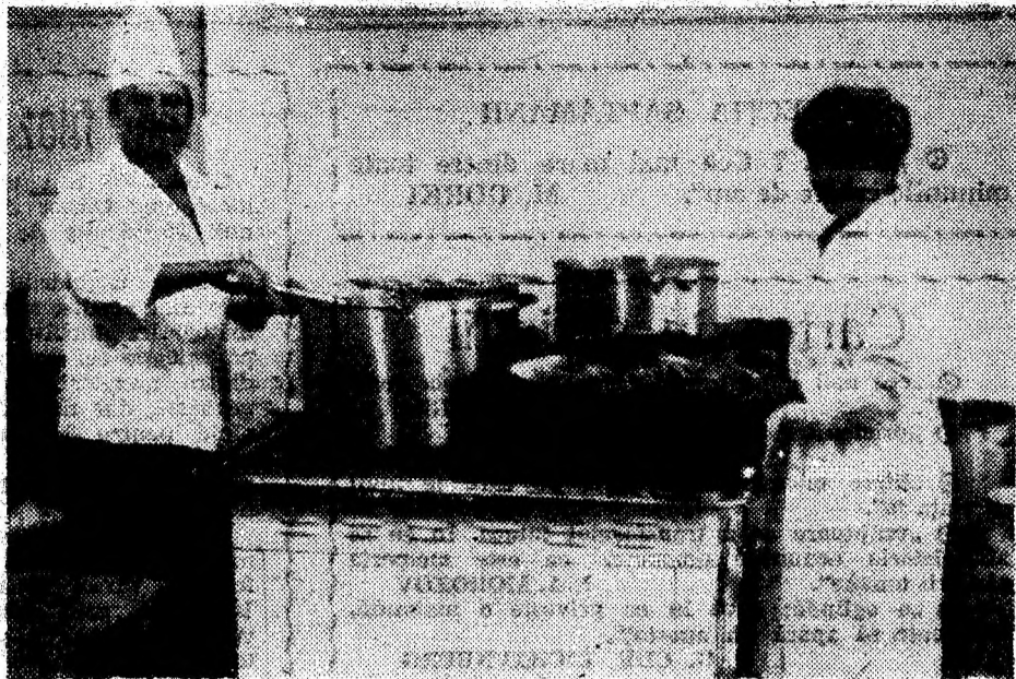
La Cantina Minei Tebea, îndemânarea și priceperea bucătarilor nu este dezmințită.

Și la lucrările de investiții avansările realizate de 873 m sunt peste cele preliminate de 869 m, astfel ea până la sfârșitul anului activitatea de investiții să se încadreze la nivelul indicatorilor planificați.