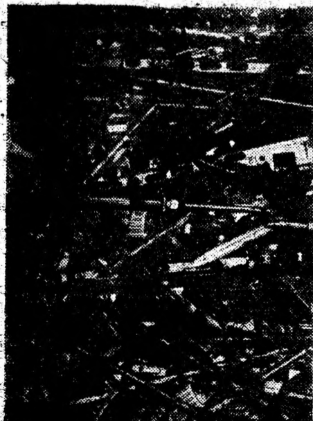
Arme dezafectate, schije, obuze și șrapnele — o inedită materie primă pentru opere de artă cu mesaj antirăzboinic.