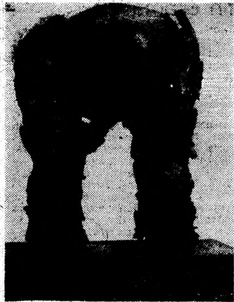
„MAINILE“ — o operă de artă realizată prin sudură din schije, obuze și șrapnele. Soarta omeniilor se află în mâinile omului, pare a spune autorul.

Bled — o minunată așezare turistică din nord-vestul fostei Iugoslavii (așezată în jurul unui lac alpin ce are în mijlocul său o insulă minusculă, pe care