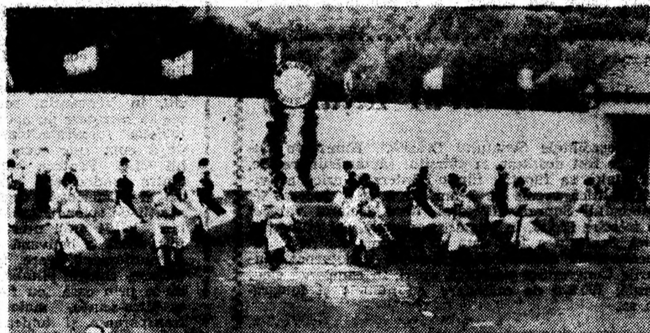
Să ne reamintim de Costești '94.