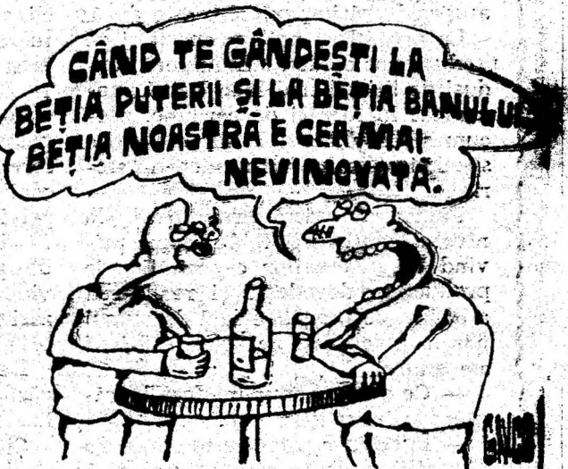
Desen de CONSTANTIN GAVRILA

tre plantele neleguminoase ar reduce sensibil necesitatea fabricării și administrării îngrășămintelor chimice cu azot. Omenirea s-ar elibera măcar parțial de povara uriașelor cheltuieli necesitate de fabricarea și manipularea îngrășămintelor cu azot și s-ar putea economisi costuții însemnate de gaz metan, Fotodată, s-ar elimina una din principalele cauze ale poluării aerului, ș.a. Motivat: fixarea azotului atmosferic de către plantele agricole. (N.Z.)