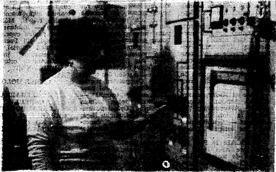
Securitatea oamenilor din subteran este urmărită cu atenție de la stația telegizometrică.

Mina Tebea exploatează în perioada 1954—1968 stratele I și II. Deschiderea zăcămintului s-a făcut prin planuri inclinate și un puț de extracție, producția minei fiind în 1968 de 150 000 t.