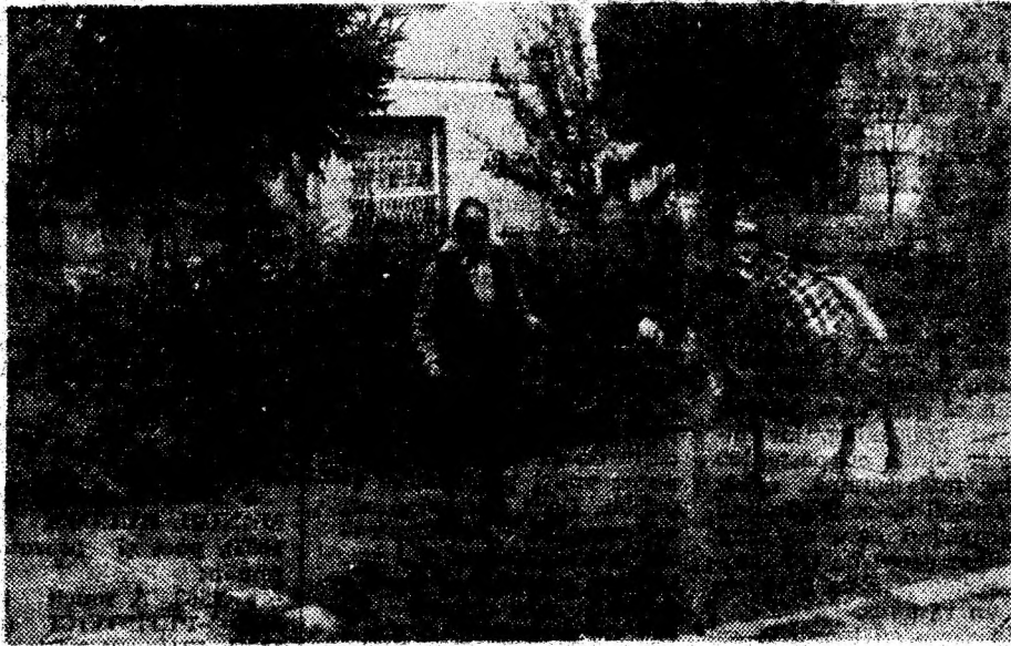
Cu măgărușul la oraș.