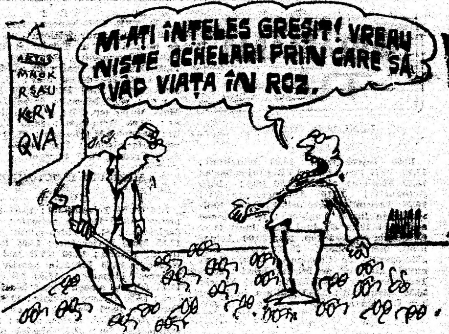
Desen de CONSTANTIN GAVBILA

• Anunț dintr-un ziar: „Azi dimineată, la ma-