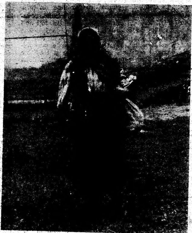
Cu traista în oraș.