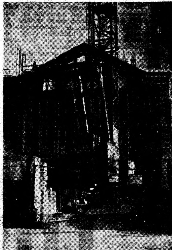
Pe strada Mihai Eminescu din Deva se lucrează intens la noul sediu al Direcției de poștă.

inșă vreau să spun ceva deosebit de important pentru turism, pentru atragerea vizitatorilor externi. Doar turismul, doar cadrul natural nu-i vor atrage pe turiști dacă nu sunt reparate drumurile, marcate și semnalizate în mod corespunzător, dacă nu se asigură în hoteluri și în cabane, ca și în unitățile de alimentație publică, de comerț în general, condiții corespunzătoare — fond de marfă, sollicitudine, ordine și curățenie, seriozitate —, dacă nu se pun la punct valoroasele noastre monumente istorice, obiectivele muzeale etc., dacă nu se înțelege imperativul buneii gospodării a localităților.