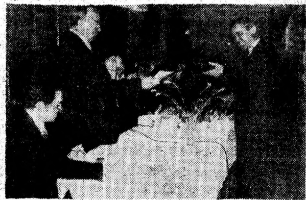
Satisfacție pentru cei premiați și intrați în „Topul firmelor pe anul 1993”.

Parada modei și atmosfera specifică unei astfel de reuniuni au completat o acțiune benefică pentru toți cei prezenți. (V.N.).