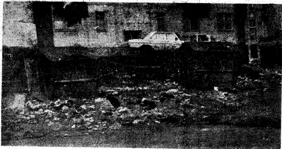
Așa arată containerele de gunoi din Micro 15, Deva, din spatele blocului