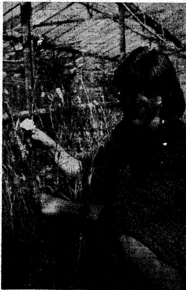
La Sansere — Sintandrei, toamna este întâmpinată cu o nouă recoltă de... garoafe.