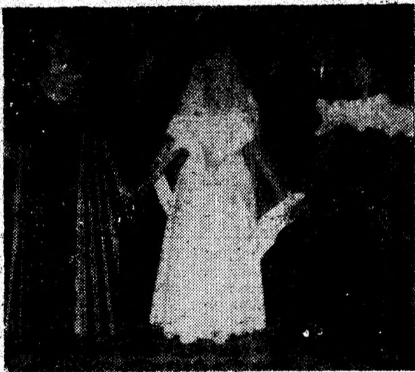
Tinerețe, frumusețe, în genuitate...