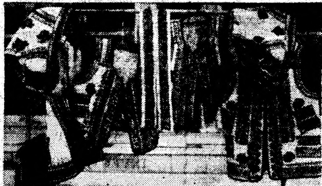
Exponate în Târgul meșterilor populari, organizat cu puțin timp în urmă la Deva.