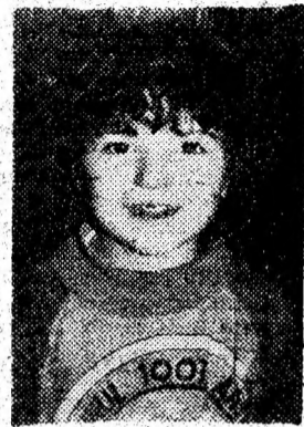
ALIN BURLACU — Simeria: „Portret de fată”. (Concursul foto cu premii).

■ Indienii, thinghiți de pe litoralul de Nord-Vest al Americii trebuie să lucreze pentru părinții viitoare soții timp de doi ani, ca să-i poată cere fetei mâna. La noi, când măriți o fată, e posibil ca doi ani să plătești numai cheltuielile de la nun-