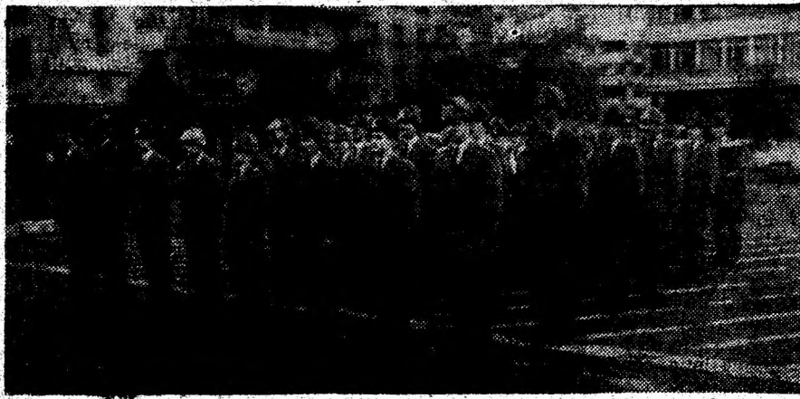
Moment din festival.

Primele trei locuri la această secțiune au revenit, în ordine, ostașilor de la U.M. 01719 Deva, U.M. 0812 Orăștie și U.M. 01032 Petroșani. Tuturor li s-au adresat felicitări. Noi le adresăm și organizatorilor.