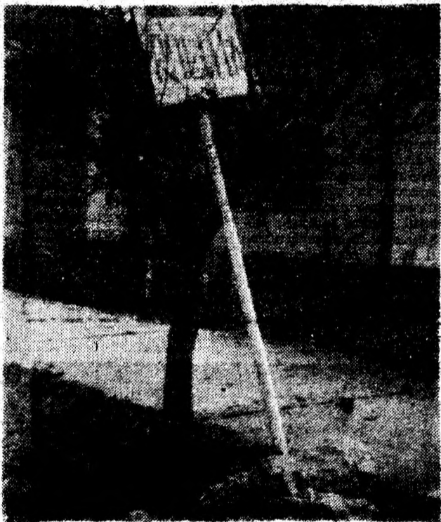
Imagine din centrul comunei Geoagiu. Sau poate am greșit noi adresa?

Să sperăm că iarna care se apropie va găsi soba oferită de Primărie în funcțiune și, mai ales, multă căldură în Biblioteca din Geoagiu. MINEL BODEA