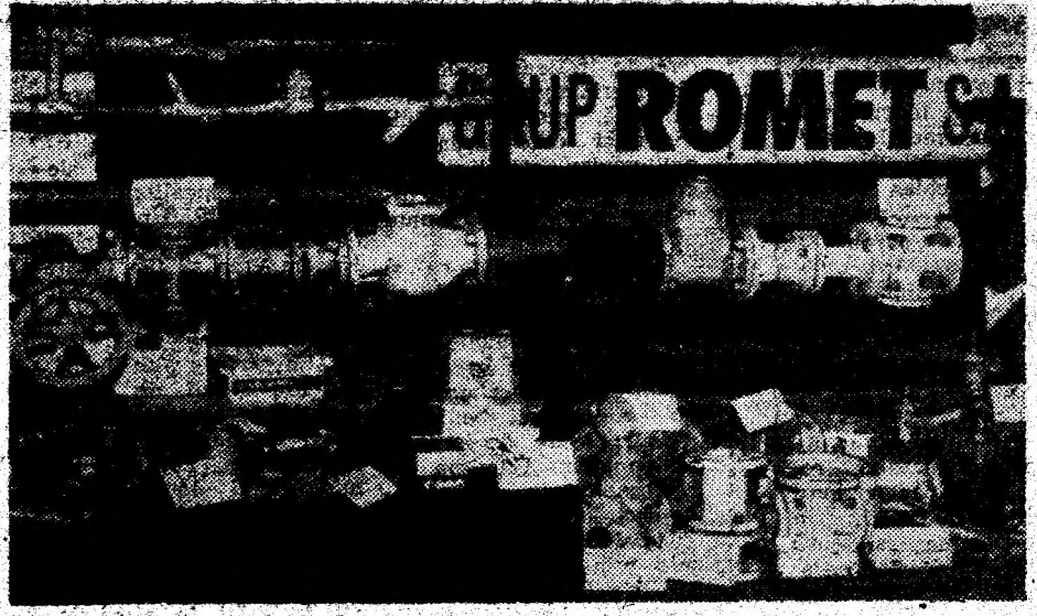
Cu prilejul celei de a V-a Conferințe anuale a Asociației profesionale și patronale a gospodăriei comunale și locative și a simpozionului „Protecția mediului și salubritatea urbană”, la Casa de Cultură din Deva s-a organizat și o interesantă expoziție cu aparatură, dispozitive și utilaje de concepție și construcție românească destinate activității de gospodărie comunală. Exponatele au stârnit un viu interes participanților la conferință și simpozion.