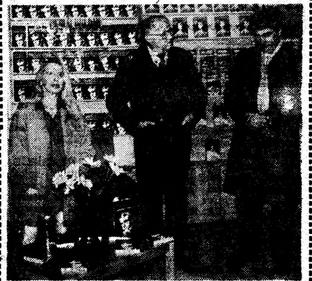
Aspect de la lansarea cărții „Confesiuni violente” de Nicolae Breban.

La Casa Cărții din Deva a avut loc lansarea cărții „Confesiuni violente” de Nicolae Breban, manifestare organizată de S.C. „Bibliofor” S.A. Deva. Volumul, apărut la Editura „Du Style” din București, a fost prezentat de scriitorul Doina Uricaru, directorul Editurii „Du Style”. Ne aflăm într-un maraton al lansărilor, a precizat dânsa celor prezenți la manifestare, de la Constanța la București și acum la Deva, urmând ca după-masă să fim la Cluj-Napoca. Am inclus în acest turneu al nostru Deva, întrucât aici există un pu-