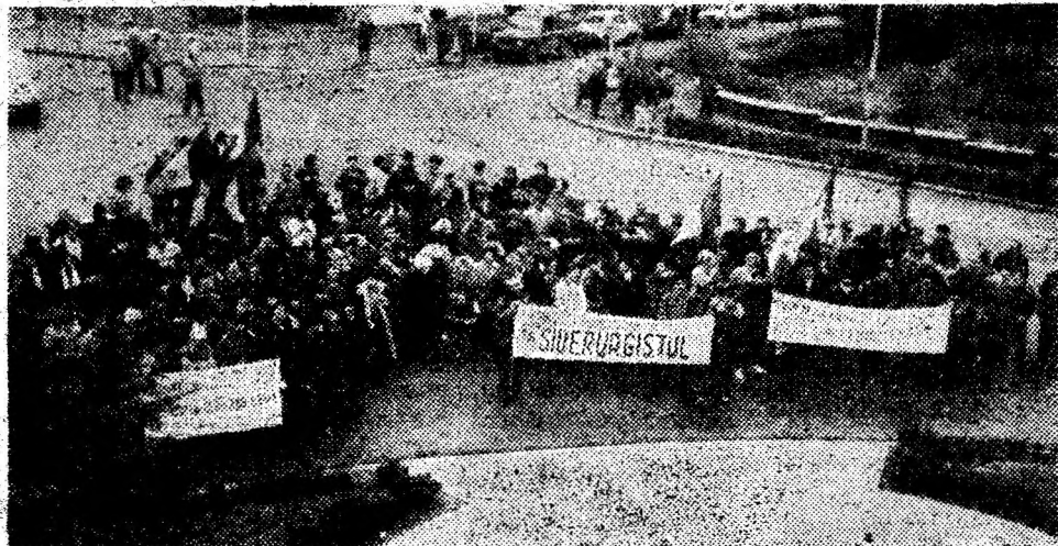
Aspect de la Mitingul de protest desfășurat ieri la Deva.

Ieri, în fața Prefecturii județului, a avut loc un miting de protest, cu participarea a numeroși salariați de la Combinatul Siderurgic Hunedoara.