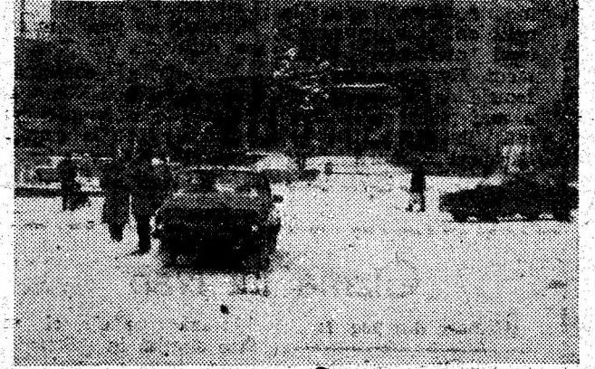
În plin centrul Devei, pietonii circulă pe unde vor și pe unde... pot.