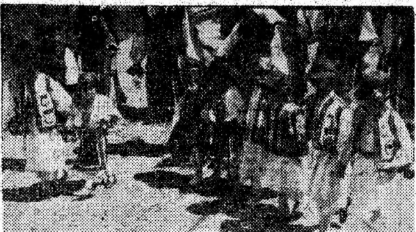
Uite-asa se joacă fata...