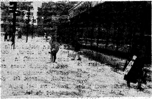
La magazinul „Tinerețului” (str. Libertății, colț cu bulevardul Decebal), câteva salariațe au pus mâna pe lopeti și au înlăturat covorul alb așternut în jur.