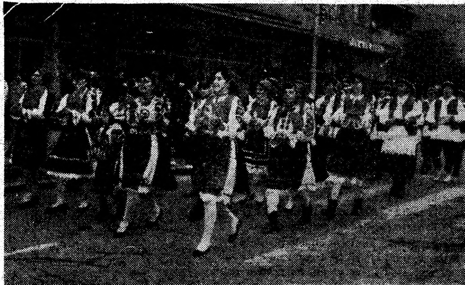
Fetele și femeile din satele noastre pe lângă truda de a-și gospodări casele, priceperea și dragostea de frumos cu care-și împodobesc locuințele ori costumele populare, au și menirea sfântă de a păstra datinile și obiceiurile tradiționale.

fără un soț copiii. Sunt atâtea semene ale noastre obligate să se lupte cu viața pe cont propriu, fără sprijinul material, ori moral al unui bărbat, care să le dea sentimentul că sunt iubite și ocrotite, că nu sunt o frunză luată de vânt. Lor, femeilor singure, le închinăm un gând bun la început de an, le dorim să aibă puterea să-și suporte soarta. Ne-am bucura dacă în singurătatea lor ar simți că rubrica „Femina“ le este aproape, dacă prin intermediul ei ar reuși să realizeze un dialog cu alte femei aflate în situații similare. O singurătate împărțită e mai puțin apăsătoare. (V. ROMAN)