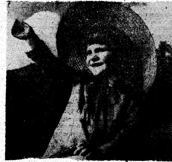
„ANA - MARIA“

male. Descoperirea este valoroasă întrucât s-a constatat că această maladie se află pe primele locuri în „topul“ deceselor datorate cancerului.