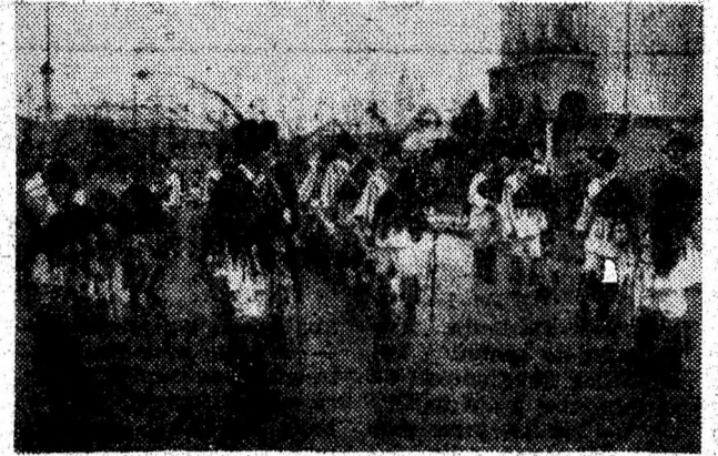
Călușari în timpul paradei portului popular de la Orăștie, în cadrul ediției a XXVI-a a Festivalului „Călușerul transilvănean”.