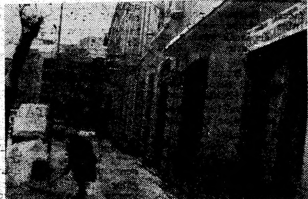
Sâmbătă, Primăria municipiului Deva era „implicată” în curățarea zăpezii din oraș, prin cea mai fidelă salariață a lor, portăreasa, care curăța trotuarul din fața „Casei Căsătoritorilor”.

„Nu am aplicat nici una — ne spune. Am încercat să mergem cu vorba bună. Dar dacă așa nu se înțelege, vom aplica și amenzi”. (E. S.)