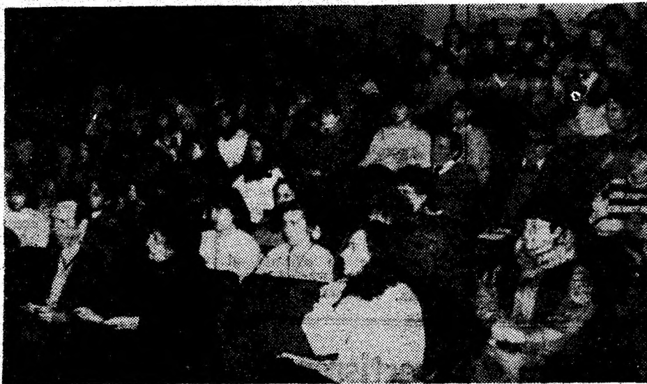
Participanți la simpozionul dedicat împlinirii a 145 de ani de la nașterea Luceafărului poeziei românești, manifestare găzduită de Casa de Cultură din Deva.

creația eminesciană, studii critice, de istorie literară, monografii despre poet. Celor prezenți le-a fost astfel trezit interesul pentru adâncirea studiului privind scrierile Luceafărului poeziei românești, prin creșterea nu-