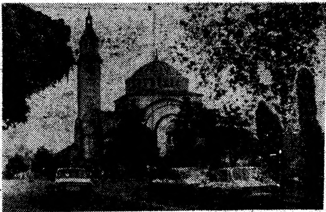
Gafedra Ortodoxă din centrul municipiului Orăștie.

administrative ale coloniștilor — se transformă, prin reorganizarea din anul 1224, în „scaune”. Orăștie devine, astfel, sediul unuia din cele șapte scaune săsești din Transilvania”. Documentul care atestă existența Orăștiei este o diplomă a regelui Ungariei, Andrei al II-lea, datată din anul 1224. Orașul a avut mult de suferit în timp din pricina diverselor cotoștiri: invazia tătarilor de la 1241, cotoștirea turcească de la 1420 ș.a. În anul 1479, la locul numit Câmpul Pâinii, oastea transilvană, condusă de Ștefan Băthory și de comitele român Paul Chinezul, a obținut o strălucită victorie asupra turcilor. Așezarea se reface treptat, iar la sfârșitul secolului al XV-lea e declarată oraș — „civitas”, în care