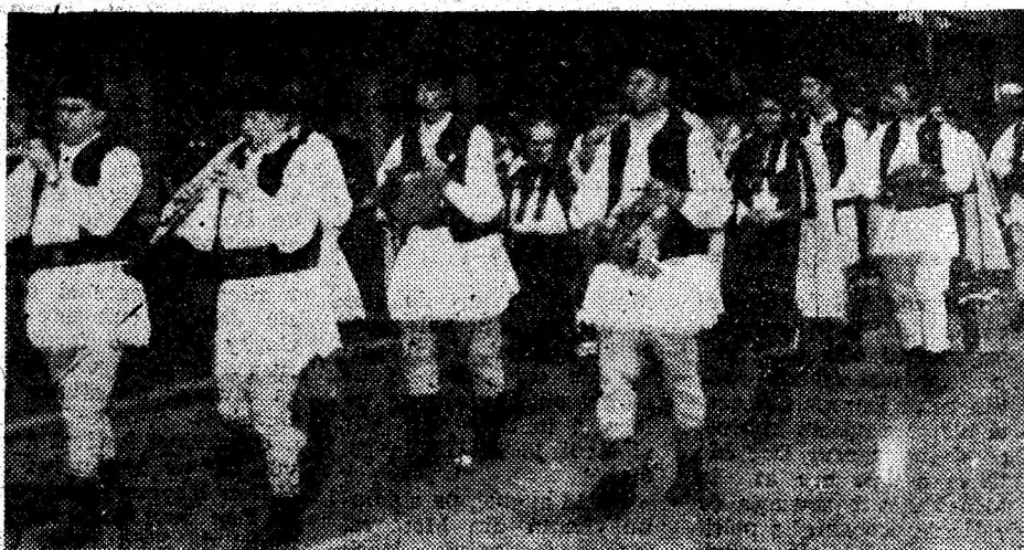
Dubași la Festivalul ob iceiurilor de iarnă de la Deva.