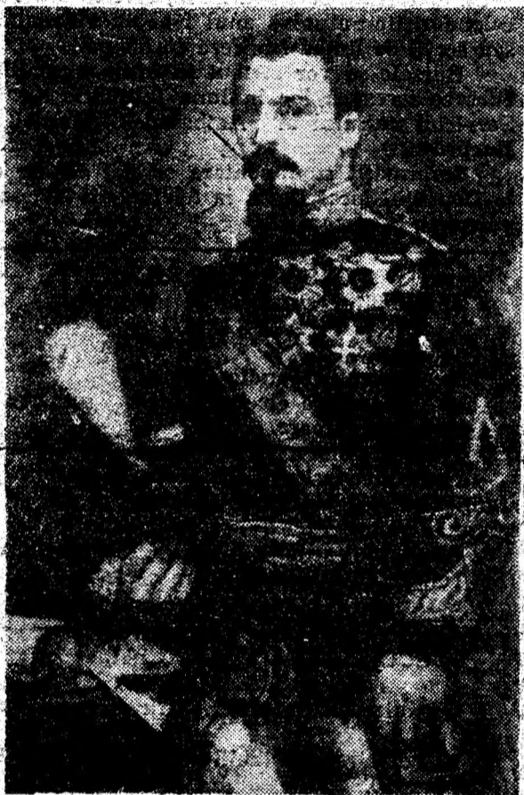
ALEXANDRU IOAN CUZA, primul domnitor al Principatelor Unite

Cu toate că revendicările unirii au reținut atenția puterilor europene începând cu mijlocul secolului trecut, care au susținut sau au fost împotriva acestei idei, în funcție de interesele lor, factorul hotărâtor al unirii l-a constituit lupta fermă și tenace a mase- lor. Mile de țărani și locuitori ai orașelor, care