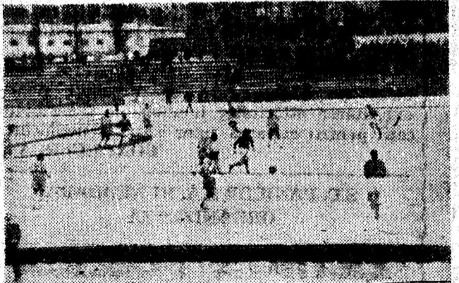
Înfruntând zăpada și gerul, fotbaliștii își continuă antrenamentele