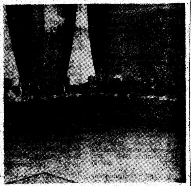
Aspect din timpul desfășurării Conferinței pe țară a inspectorilor generali adjuncți ai inspectoratelor școlare județene.

(Urmare din pag. 1) pregătirea profesorilor, s-au lansat concursuri de manuale pentru elaborarea manualelor alternative ș.a. Se afirma pe drept cuvânt în cadrul consfățuirii că toate aceste proiecte nu se simt încă la nivelul învățământului pre-universitar, în școli în ultimă instanță. Anul 1995 va fi unul al începerii aplicării lor, succesul reformei depinzând de ceea ce se va reuși să se facă la nivelul profesorului care predă nemijlocit și care trebuie să fie convins el însuși de calitatea a ceea ce se întreprinde, iar ținta trebuie să o constituie elevul la care se ajunge prin intermediul învățătorului, profesorului și al directorului de școală. Suntem singura țară din centrul și estul Europei, dădeau asigurări în cadrul consfățuirii reprezentanții Ministerului învățământului, care au un program coerent de reformă, iar succesul ei depinde implicit de parteneriatul, de sprijinul unităților economice, al instituțiilor, al consiliilor locale și nu în ultimul rând al părinților.