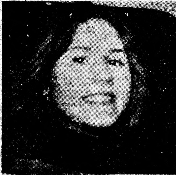
Puțină atenție băieți! Un zâmbet de la Hunedoara.