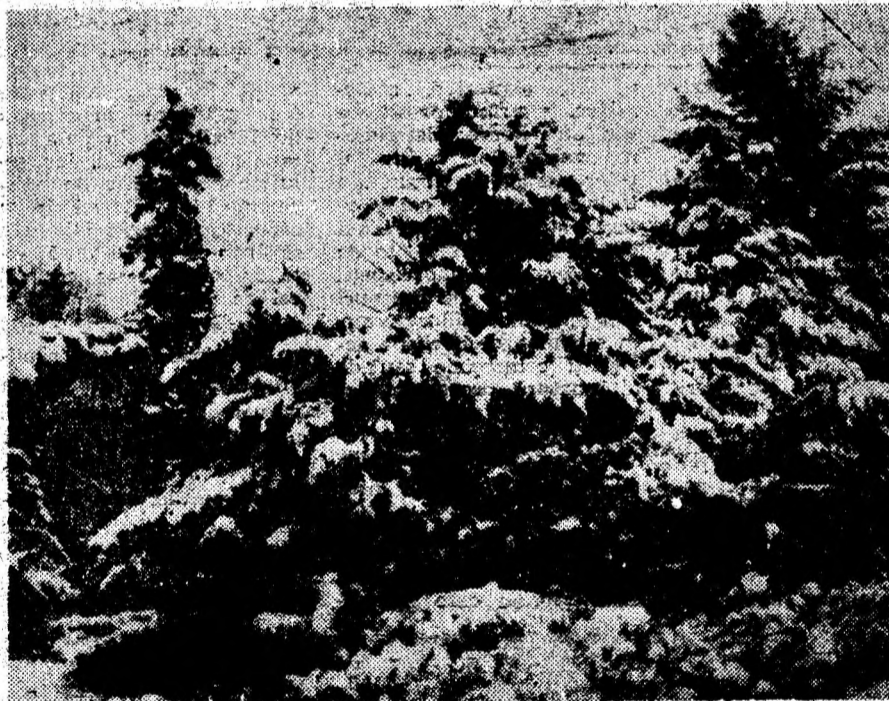
Acolo, sus, la munte...