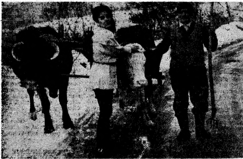
Rupe-or boii tănău? Nu știm. Dar cert este că acum e momentul transportării gnoiuului în câmp.

— Iubito, pentru tine sunt în stare să fac un tunel chiar și sub Himalaia!