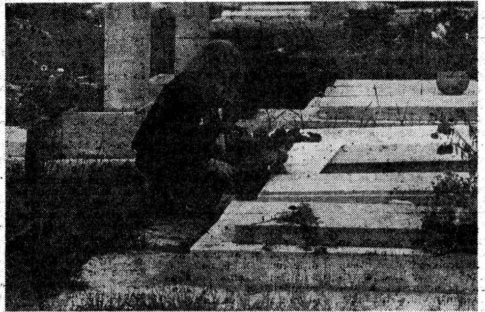
O lacrimă și o floare pentru fiul căzut în Decembrie 1989.