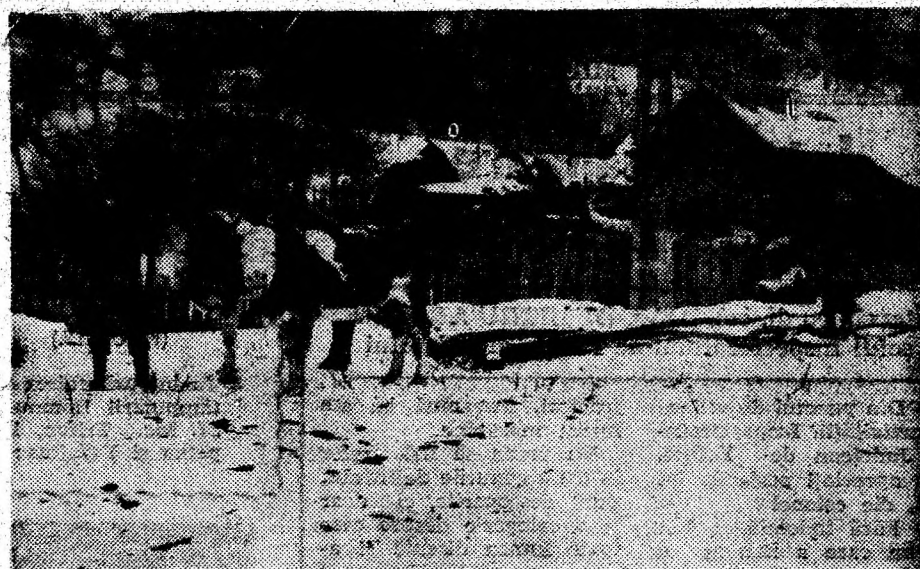
Transportul lemnului din pădure cu vacile.