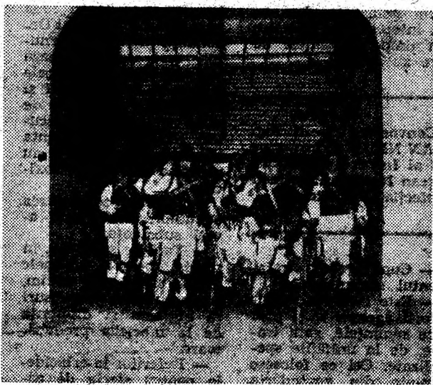
Întrând pe poarta ga zdel, călușerii din Boiu aduc cu ei bucuria unui obicei de iarnă ancestral.

— N-aș mai fi eu, dacă n-aș crede! Nu pentru că sunt (efemer) într-o anumită funcție sau pentru că lucrez în acest domeniu. Ci, pentru că e de neconștient existența unei națiuni fără cultură populară în general și CULTURĂ în special. În ceea ce privește județul Hunedoara, ea și întreaga țară, vetrele noastre folclorice și-au dovedit de-a lungul timpului perenitatea și nu văd cum ar putea să nu mai fie active în procesul de creație, pală timp cât fiecare palmă de pământ mustește a folclor, fiecare izvor surâre "doinind", fiecare frunză care foșnește "cântând" și fiecare lan se leagănă "dansând". Memoria noastră, a tuturor, este aceea de a ști să le ascultăm, de-a avea plăcerea să le cultivăm și de-a avea puterea să le ocrotim.