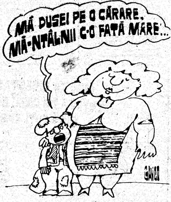
Desen de CONSTANTIN GAVRILA

Am mai reținut că apariția paralelismelor în comerț, concurența au adus schimbări radicale în bine ale atitudinii față de clienți ori față de potențialii cumpărători, că produsele industriale se vând mai anevoios decât cele alimentare, am sesizat în numeroase locuri că ordinea, chiar spălatul trotuarului și a vitrinelor stradale a intrat în obișnuit. Nu punem la îndoială sinceritatea comercianților cu care am vorbit. Opinii, alte păreri, impresii bune și mai puțin bune, privind activitatea în acest important sector al vieții noastre sociale, așteptăm și de la dv, stimați cititori.