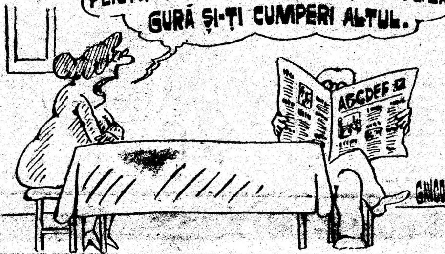
Desen de CONSTANTIN GAVRILA

VĂD CĂ CITEȘTI ZIARUL ĂSTA PENTRU A 7-A OARĂ! BINE, RUPEMI DE LA GURĂ ȘI-ȚI CUMPERI ALTUL.