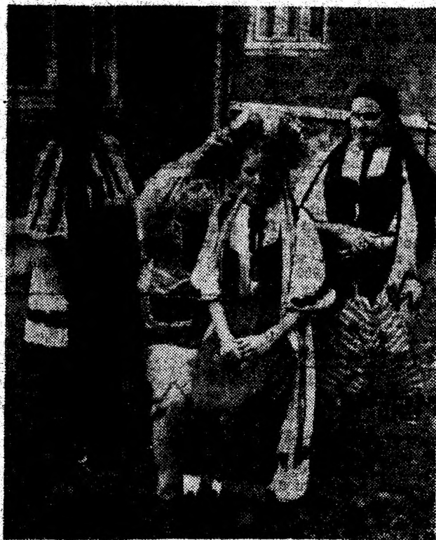
Învălițul miresii la Costești.

Venind din vremuri străvechi, având deci o istorie lungă, creațiile populare, prin încifrarea unor sensuri, concepții și rituri, au căpătat nu numai patina strălucitoare a vremii, ci și valori artistice inestimabile. Tocmai