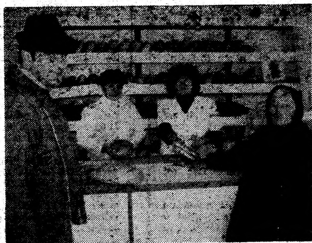
În unitatea „Company Special” din Brad, se vinde tot timpul pâine proaspătă.

• S-au născut, în 1924, EUGEN BARBU, scriitor (m. 1993); în 1927, MIRCEA MALIȚA, matematician și eseist.