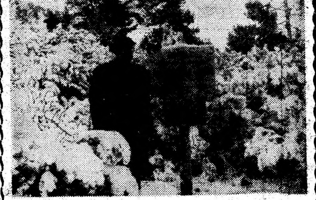
Aspect de iarnă din Rezervația științifică a Parcului Național Retezat.