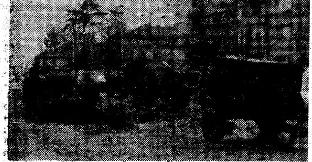
Lucrări pe carosabil în Deva, pe bdul 22 Decembrie.