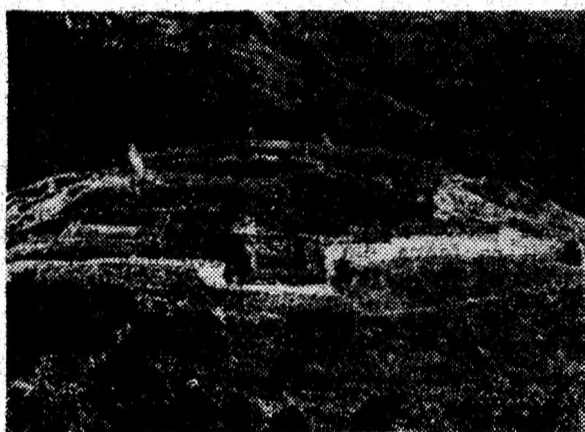
Cetatea Dacică de la Blițdaru.

Retragerea armatei și administrației romane în anul 271 nu a clintit continuitatea de viață și acțiune a locuitorilor din spațiul carpato-danubian, rămași statornici în vatra lor de viață. Numeroase mărturii arheologice demonstrează această continuitate. Astfel, în fosta capitală, populația rămasă a transformat în locuință părți din Palatul Augustalilor, iar amfiteatrul, prin blocarea porților de acces, într-o adevărată fortăreață unde se refugia în caz de primejdie. Într-una din lojele acestuia, s-a descoperit un tezaur monetar aparținând secolului al IV-lea. Lângă ruinele „vilei rustice” de la Strei au fost dezvelite mai multe locuințe și un bogat material arheolo-