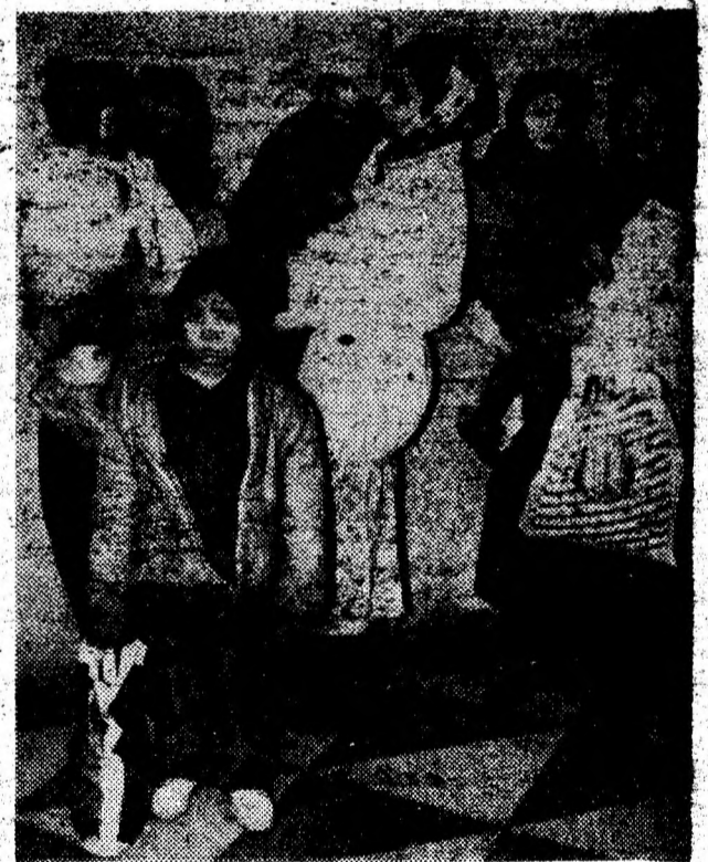
„Întâlnire la poliție”. Cam așa am putea intitula secvența de față în care copiii cerșetori s-au întâlnit cu cei ce i-au pus la „lucru”.