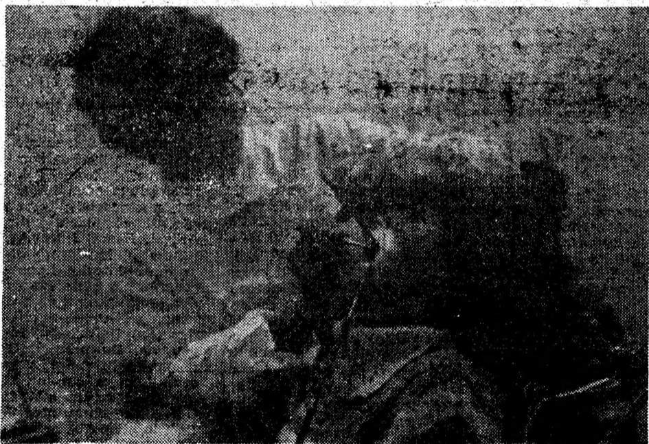
„Arme” împotriva carii lor dentare.