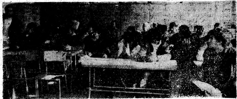
O parte dintre cei ajuși la sediul Poliției Municipiului Deva.

2 418 000 de lei ● Amendamentele contravenționale aplicate conform Legii 5/1971 — 23 la număr — s-au ridicat la suma de 425 000 de lei ● Cu acest prilej au fost depistați o seamă de infractori, indivizi certați cu legea, minori cerșetori etc. etc. (V.N.)