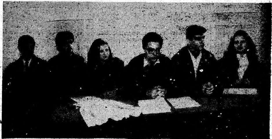
La început de drum — colegiul de redacție al Revistei „CREDO”, de la Grupul Școlar Industrial Transporturi Auto — Deva.