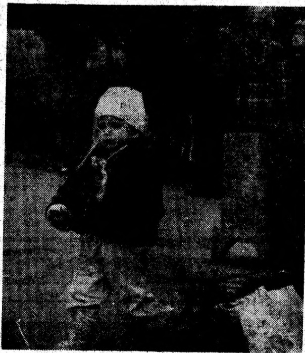
„Ghiocel pentru mămică”.

exceptând regiunile vestice, unde nebulozitatea va fi, temporar, caracteristică. Posibil ceață în locurile joase. Valorile termice vor fi pozitive și noaptea, iar la amiază vor oscila între 8° și 16° C.