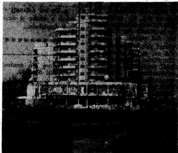
Intersecția „Lido“ Deva.