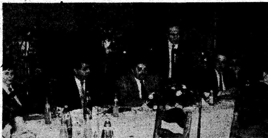
Aspect din timpul de sfășurării lucrărilor simpozionului.

Cine dorește alte relații se poate adresa la sediul firmei, situat în București, sector 1, strada Expoziției, Avenue, telefon 3122309,