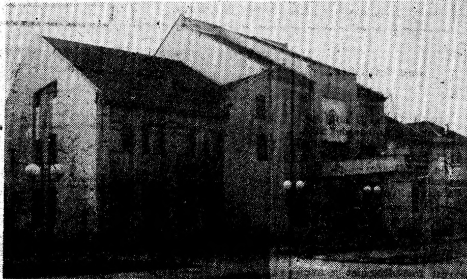
Noul sediu al Filialei Bancii Comerciale Romane, din municipiul Hunedoara.

De la bancă li s-a spus să se intereseze la Filiala județeană a F.P.S. iar de aici să întrebe la F.P.S. București. De acolo cine mai știe unde vor fi „îndrumați”, pentru a afla totuși prin ce conturi au ajuns banii și cine profită de dobânda cuvenită? (N. T.).