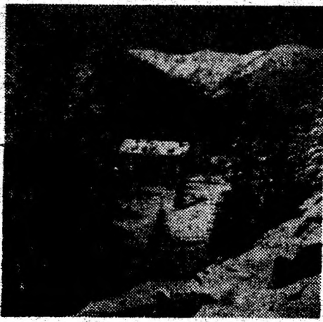
Retezat. Cabana Pietrele — 1550 m.

Dintre păsările răpitoare de zi sem-nalăm: uliul gănilor sau porumbaru-l, șoimul călător, șoimul rândunelelor, vin-derelel roșu, șorecarul comun ș.a. Mai importante sunt, însă, cele ocrotite prin lege ca acvila de stâncă, pasăre seden-tară, precum și vulturii ce vin vara din sud și populează crestele Retezatului ca hoitarul, vulturul sur și vulturul brun. Din nefericire, vulturul bărbos sau ză-gă-nul a dispărut din acest munte în ul-ti-mele decenii. Dintre păsările răpitoare de noapte pot fi amintite: bufnița mare sau buha, huhurezul de pădure, cucu-veaua pitică ș.a.