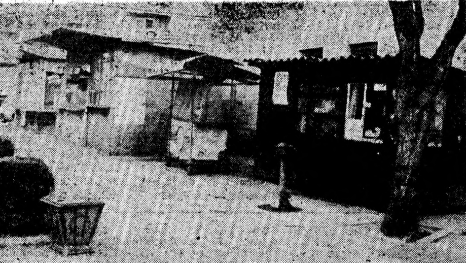
În Brad, privatizarea înaintează. Consiliul local ar trebui să aibă grijă și de aspectul unităților autorizate. Gheretele respective se află în orașul nou.