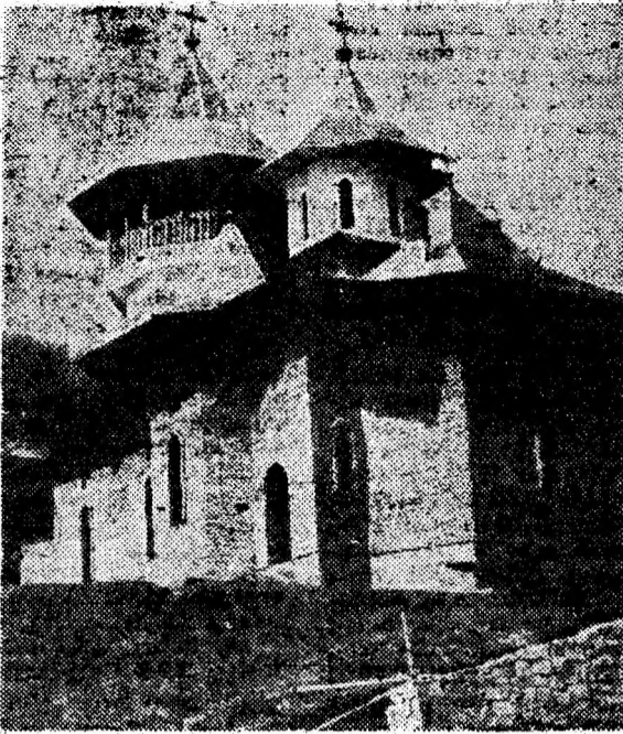
Biserica mănăstirii Crișan a fost înălțată și acoperită. Urmează tencuirea și pictarea.

pentru culte ne-a dat patru milioane. Restul ne-a fost donat de credincioși din zona Bradului, căroro le mulțumesc prin intermediul ziarului dumneavoastră și îi rugăm să fie în continuare alături de noi. Facem apel și la alți creștini cu inimă bună din județ și din țară să ne ajute cu bani, după posibilitățile fiecăruia. Bunul Dumnezeu îi iubește, îi ocrotește și îi ajută pe cei darnici. Contul nostru este la Banca Comercială Română, Filiala Brad și are numărul 45101112. Cei ce vor să ne ajute pot depune orice sume de bani și-i rugăm să fie convinși că le vom folosi cu maximă grijă în vederea reînălțării mănăstirii Crișan, așezată într-o zonă foarte frumoasă, ce va deveni loc de căință și de rugăciune către Tatăl, Fiul și Duhul Sfânt.