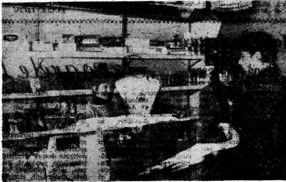
Aspect dintr-o unitate privată — „MATADOR” din Brad.