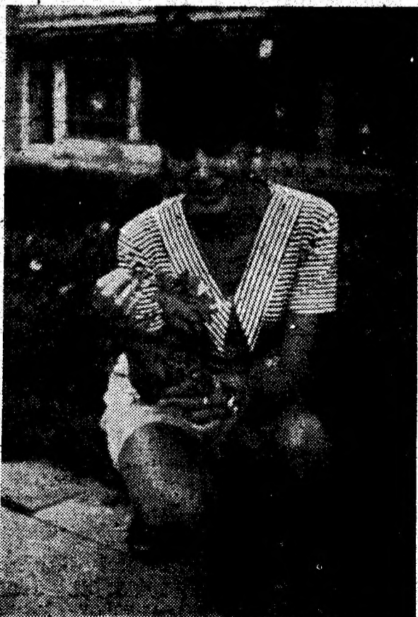
„MĂ IUBEȘTE, NU MĂ IUBEȘTE!”...

■ În combaterea unei stări de nervozitate se recomandă o baie parțială cu efect imediat: se umple chiuveta cu apă rece și se înmoaie alternativ palmele, încheieturile și coatele, timp de 2-3 minute.