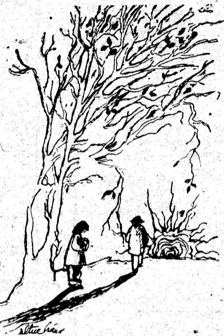
Când drumurile noastre se despart, se-ntinde-n urmă tristă amintirea. Desen de DORINA ITUL CRANG