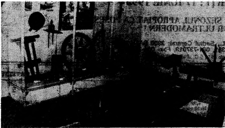
Aspect din Muzeul de etnografie de la Brad.