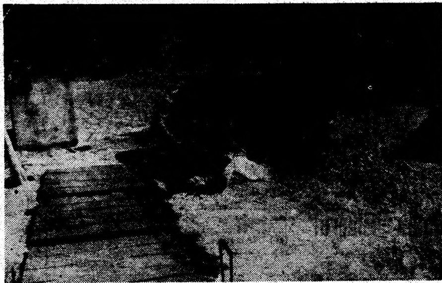
În curtea părintelui din Gurasada se confecționează boltari, bandaje de mină etc.