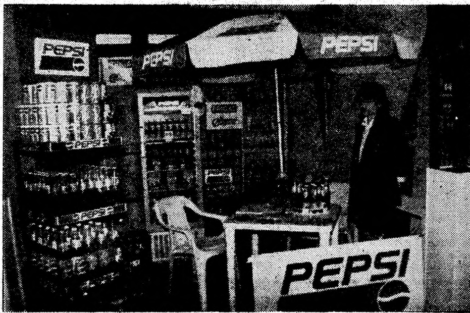
Firma Pepsi — Cola se impune pe piața băuturilor răcoritoare.

Marți, 18 aprilie. Vreme închisă, cu precipitații mai frecvente în jumătatea nordică a țării. Pe alocuri, ploaia se va transforma în lapoviță și ninsoare. Temperatura minimă se va încadra între 2 grade și 8 grade C, iar cea maximă între 6 grade și 16 grade C. Se vor semnala intensificări ale vântului.