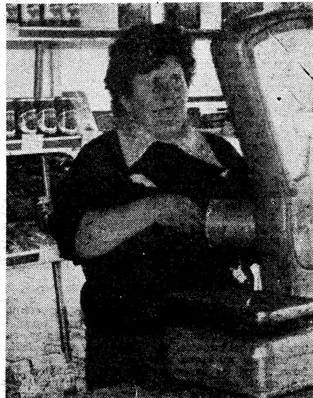
Magazinul universal din Gurasada.

S-a oprit, deci, temporar activitatea de producere a acestor obiecte, până la înlăturarea deficiențelor, aplicându-se totodată unității o amendă de 150 000 lei. (E.S.)